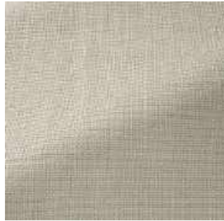
Chaux - 001