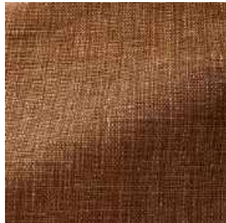
Acajou - 006