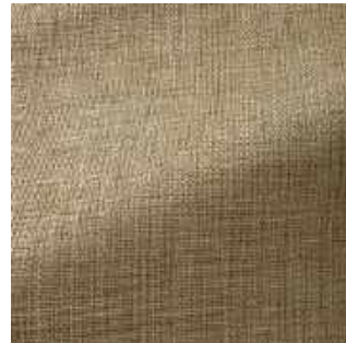
Parchemin - 007