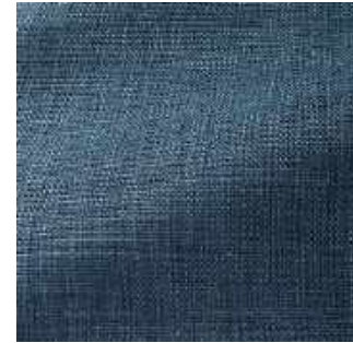
Horizon - 012