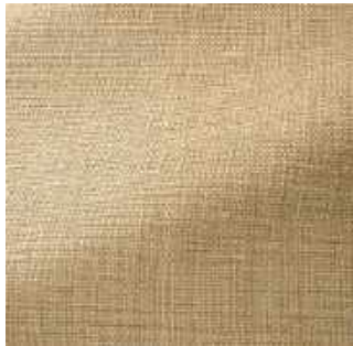
Sable - 004