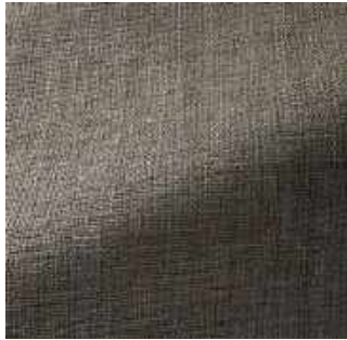
Taupe - 009