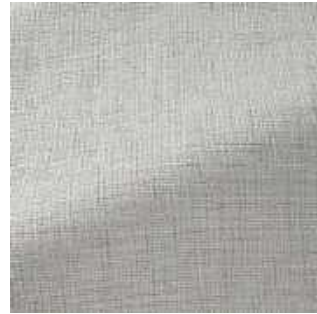
Calcaire - 002