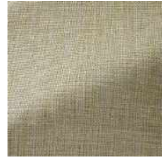
Tilleul - 003