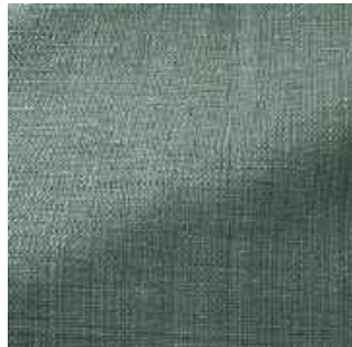
Celadon - 014