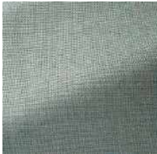
Saugé - 013