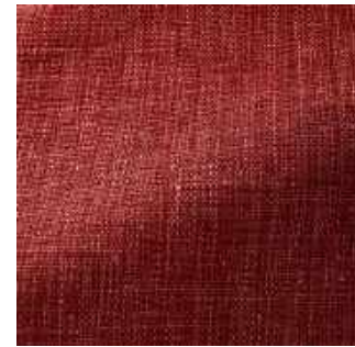
Précieux - 021