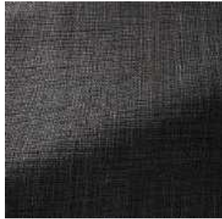
Suie - 010