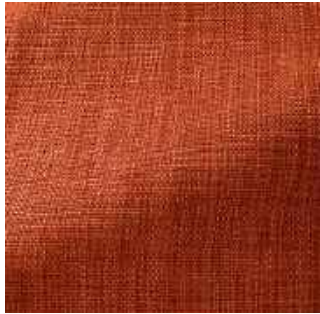
Sanguine - 020