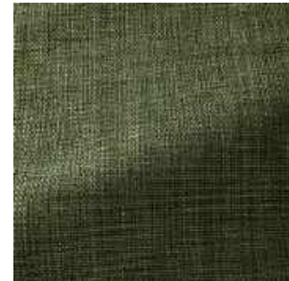
Flandres - 016