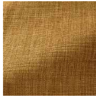
Miel - 019