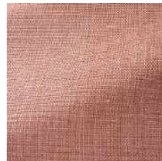
Poudre - 023