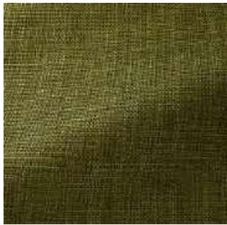
Mousse - 017