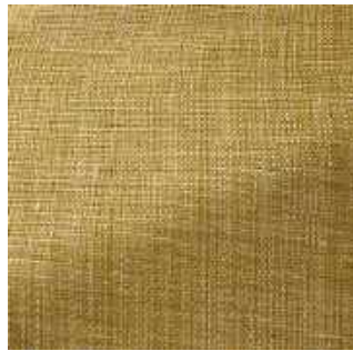
Citrine - 018