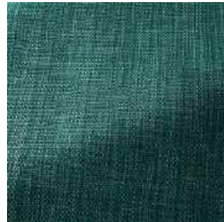
Emeraude - 015