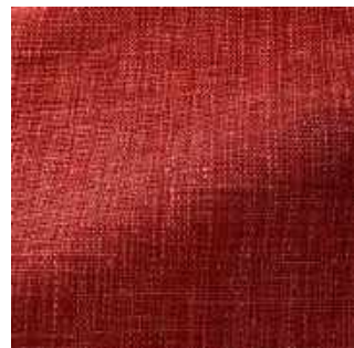
Bonbon - 022