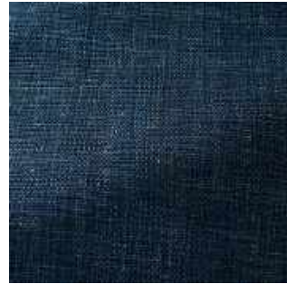
Atlantique - 011