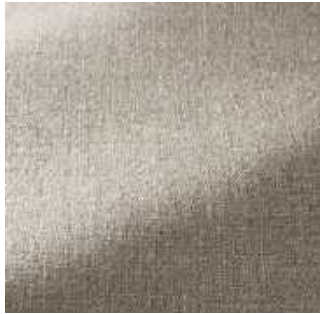
Perle - 008