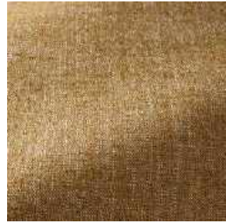
Miel - 027