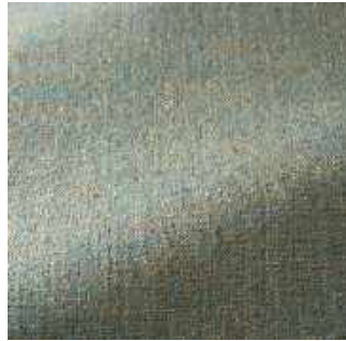
Nuage - 018