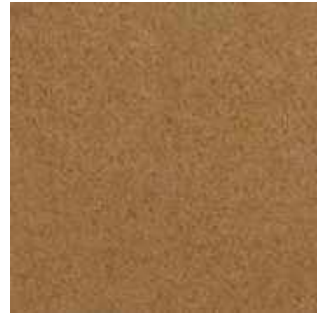
Miel - 003