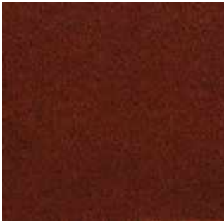
Acajou - 013