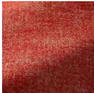
Pavot - 014