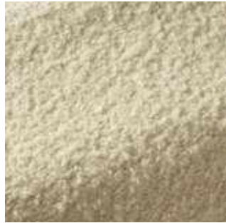
Naturel - 001