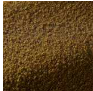
Kiwi - 013