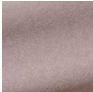
Plume - 023