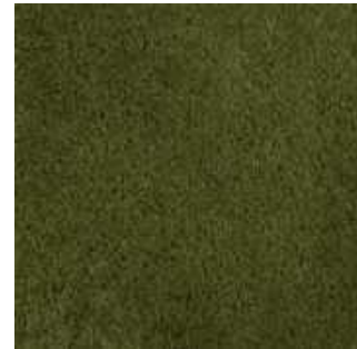
Mousse - 017