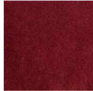
Cardinal - 012