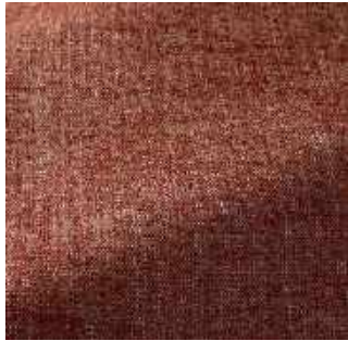
Marrakesh - 013