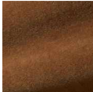
Caramel - 030