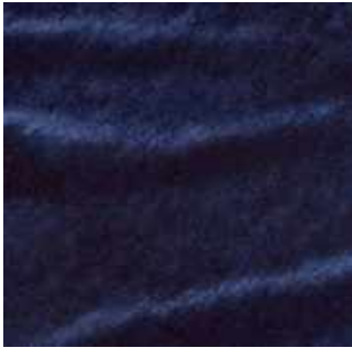
Marine - 009