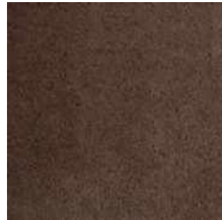
Gris Souris - 007