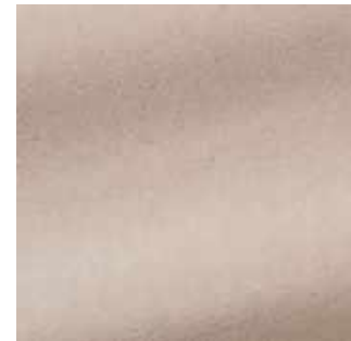
Nacre - 025