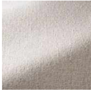
Coton - 001