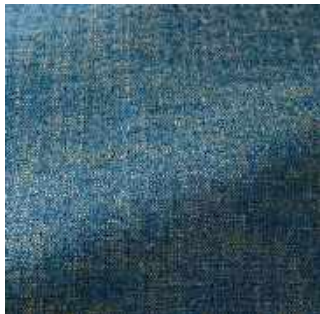
Neptune - 021