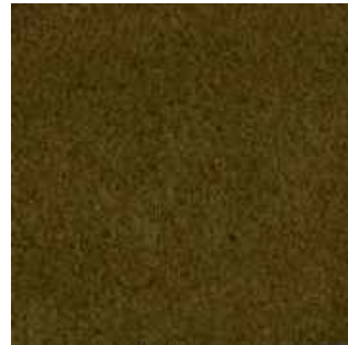
Olive - 016