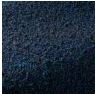
Indaco - 009