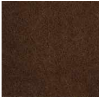
Moka - 005