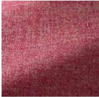
Fuchsia - 017