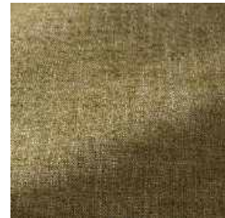
Asperge - 024