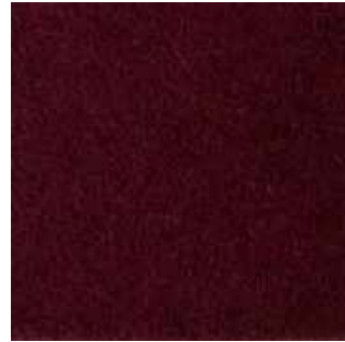
Bordeaux - 011