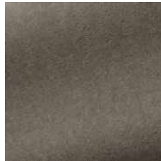
Écorce - 024