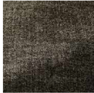
Cachou - 010