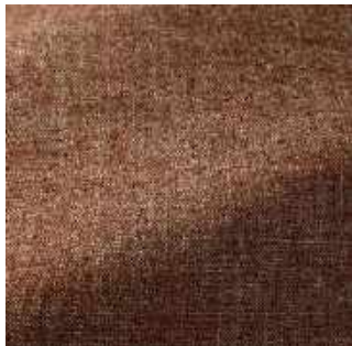
Terracotta - 012