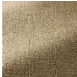
Dune - 006