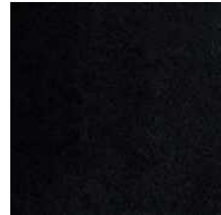
Noir - 008