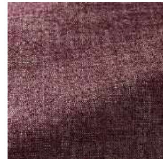
Figue - 016