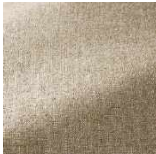
Quinoa - 005