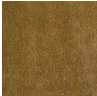
Moutarde - 015