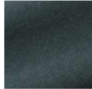
Cyclone - 021