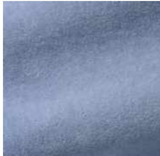
Ciel - 033