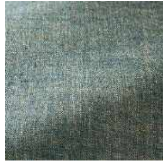
Céleste - 019