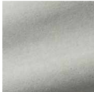
Perle - 031