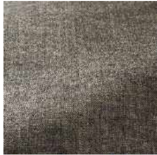
Pigeon - 009