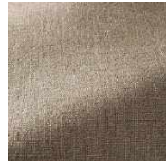
Plume - 007