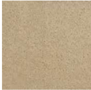
Crème - 002