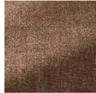
Tabac - 011