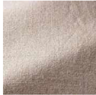
Coquillage - 002