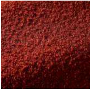
Terracotta - 006