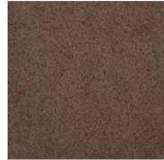
Taupe - 004