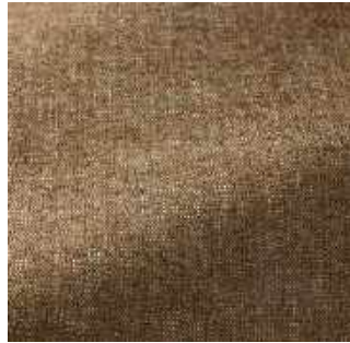
Ocre - 026