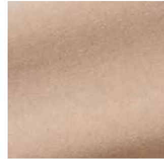
Dune - 029