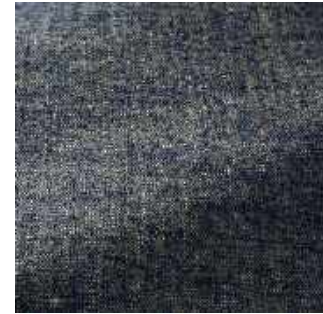
Marine - 020