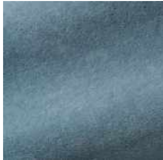
Céladon - 034