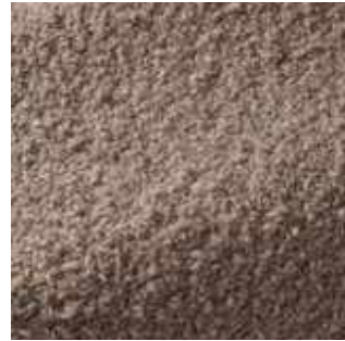
Ciottolo - 002