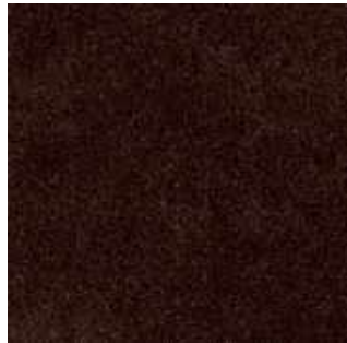
Café - 006