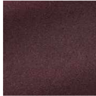
Aubergine - 020