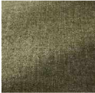
Cactus - 025