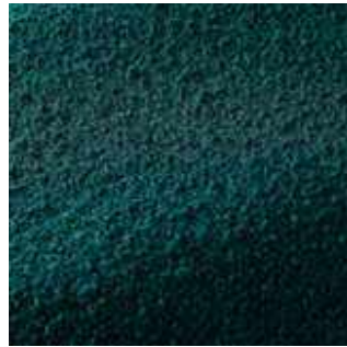
Prussiana - 010