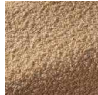
Orzo - 003