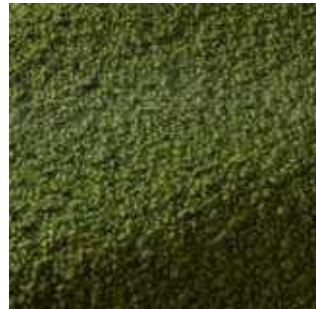
Erba - 012