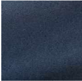
Orage - 018