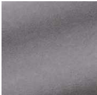
Tourterelle - 022