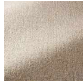
Macadamia - 003