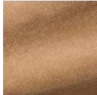
Bambi - 035