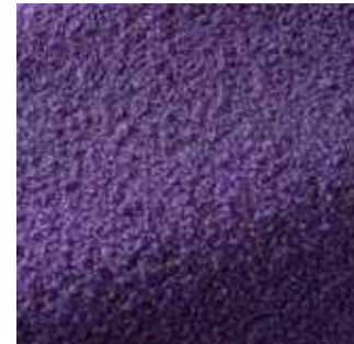
Porpora - 008