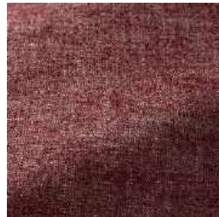
Sangria - 015