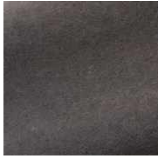
Éléphant - 019