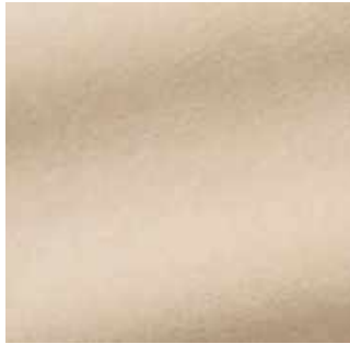
Sable - 026