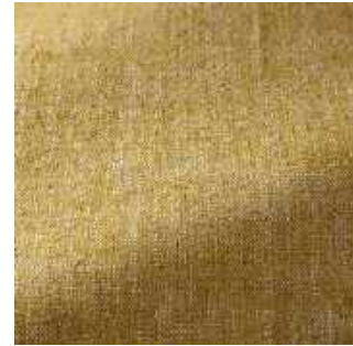
Poussin - 028