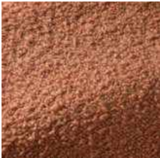
Pesca - 004