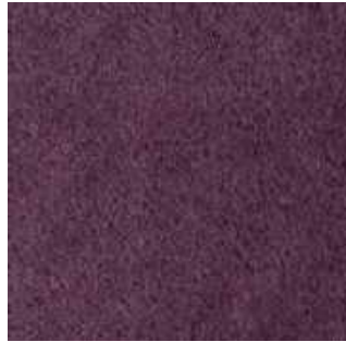
Amethyste - 010