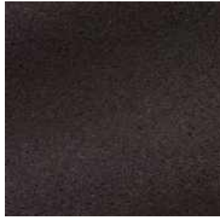
Choco - 027