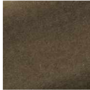
Hérisson - 028