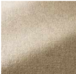
Gingembre - 004