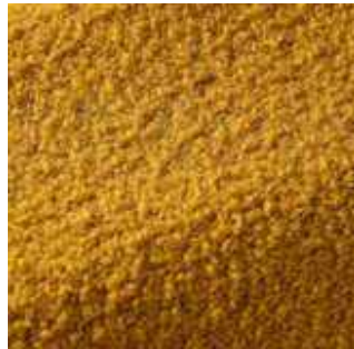
Ambra - 005