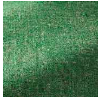
Emeraude - 023