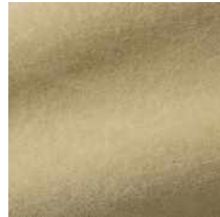
Graminées - 032