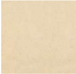
Ivoire - 001