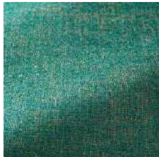
Turquoise - 022